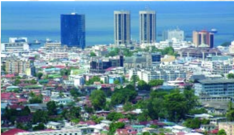
El ciudad de Puerto España, capital de Trinidad y Tobago

El complejo propuesto tendrá dos torres de 20 pisos cada una. Una de las torres alojará la Secretaría del ALCA, la otra será un hotel de cinco estrellas con 400 habitaciones y un parqueadero de varios pisos. El lugar tendrá una sala de conferencias para 2500 personas, un auditorio con una capacidad de 700 puestos y una sala de exhibiciones.