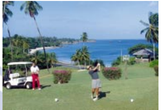
Cancha de golf Mt. Irvine, Tobago

Cuando se compara con otros grandes centros metropolitanos, el tiempo libre, el bajo costo de los servicios públicos, transporte, comida hacen que este lugar tenga un alto nivel de vida. Trinidad y Tobago posee una sociedad diversificada social y culturalmente, complementada con una democracia estable y un clima de negocios dinámico hace de esta República de dos islas el sitio de selección natural para establecer la sede del ALCA.