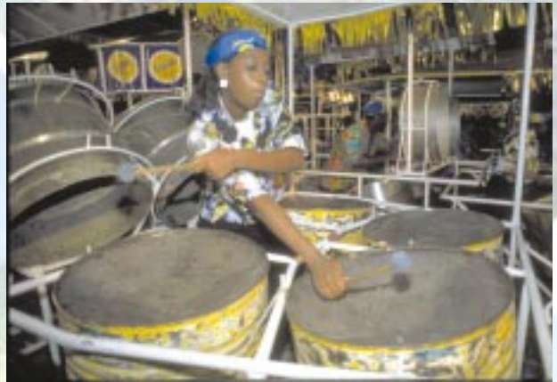
El sonido animadísimo de steelpan

Trinidad y Tobago disfruta de una mezcla de religiones y culturas. Cada denominación tiene prácticas que se incluyen en el calendario religioso nacional. En la esfera cultural, el país se alardea de haber creado el único instrumento de percusión no-electrónico en el siglo XX, el “steelpan”. Trinidad y Tobago posee varias expresiones culturales únicas tales como: el Chutney, la parranda, la tasa, el calipso, la soca y el rapso. Estas expresiones artísticas han sido inyectadas con el vigor del nuevo mundo para reflejar la creatividad y vitalidad de su gente y coexisten con la música y la cultura tradicionales.