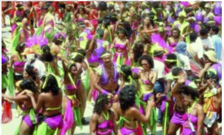
Carnaval de Trinidad y Tobago

Estas dos islas juntas ofrecen, cultural y étnicamente, la sociedad más variada de la región. La mayoría de su población es descendiente de africanos e indios con una marcada minoría de Europa, Medio Oriente y China, así como también numerosas mezclas. Todas han realizado valiosos aportes al desarrollo cultural de la nación.