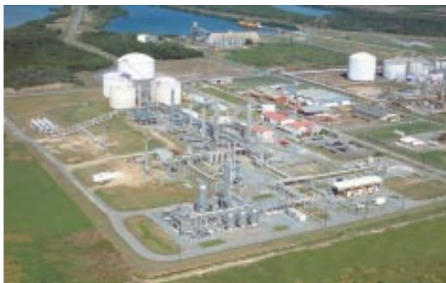
Una de nuestras plantas procesadoras de gas más grande

Las enormes reservas de crudo y gas natural hacen de su economía una de las más fuertes del Hemisferio Occidental. Es un líder mundial en la producción de petróleo y exportación de amonio y es el mayor exportador de gas natural. Va en camino a convertirse en el primer productor de metanol. El país es uno de los mayores productores de asfalto, amoníaco y urea en el mundo.