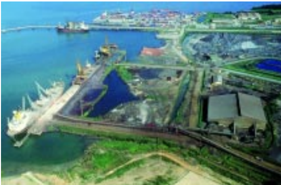
Parque Industrial de Point Lisas

El gobierno de Trinidad y Tobago se asegurará de darle prioridad, en el abordaje y en el proceso de salida, a todos los delegados del ALCA en la aerolínea nacional BWIA, tratamiento especial en aduana e inmigración para todos los diplomáticos que lleven consigo pasaportes diplomáticos y oficiales.