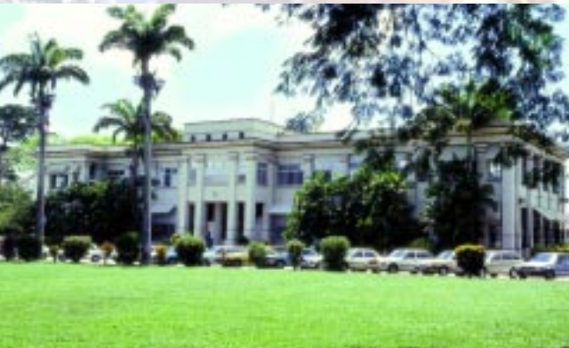
Universidad de las Indias Occidentales (UWI, St. Augustine)

Trinidad y Tobago es el hogar de una de las sedes universitarias de la Universidad de Las Indias Occidentales (UWI, San Agustín). Hay disponibles varias instituciones de educación técnica y superior.