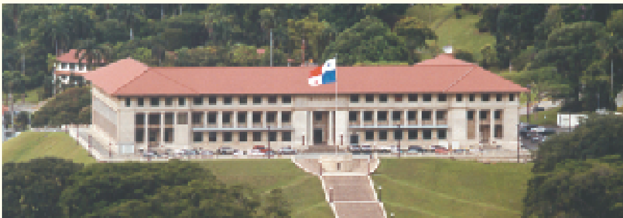
Edificio de la administración de la Autoridad del Canal de Panamá

Favorecer a Panamá como Sede Permanente del ALCA es asegurar el carácter de independencia en la administración e implementación de este crucial acuerdo comercial para el continente americano. Panamá se compromete a ejercer de manera neutral su papel de sede, de ser elegida como anfitrión permanente del ALCA, lo cual a no dudarlo, implica un compromiso en igualdad de condiciones con cada uno de los países del hemisferio para atender sus expectativas y necesidades en la implementación de un tratado que debe ser una herramienta de bienestar y progreso para las 34 naciones del hemisferio occidental que en la actualidad negocian este importante acuerdo de integración regional.