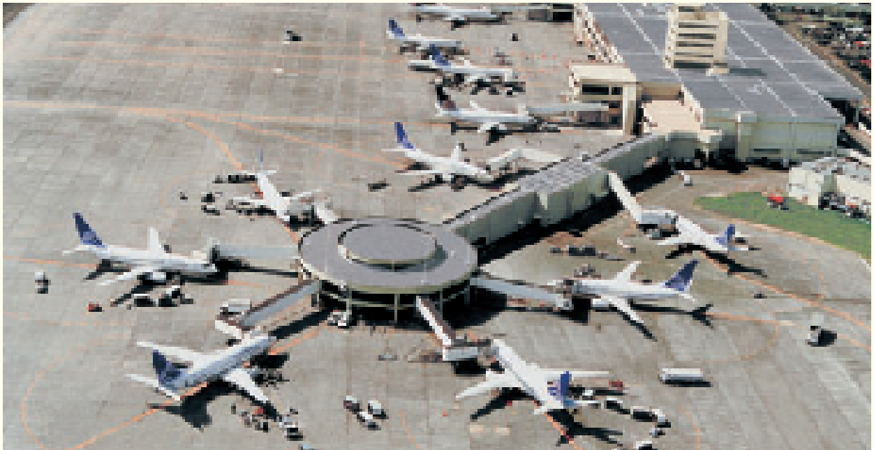
Aeropuerto Internacional de Tocumen - Hub de las Américas